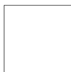
60X60 CM Rett. / Nat. 24"X24" Rect. / Nat.