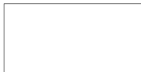
60X120 CM Rett. 24"X48" Rect.