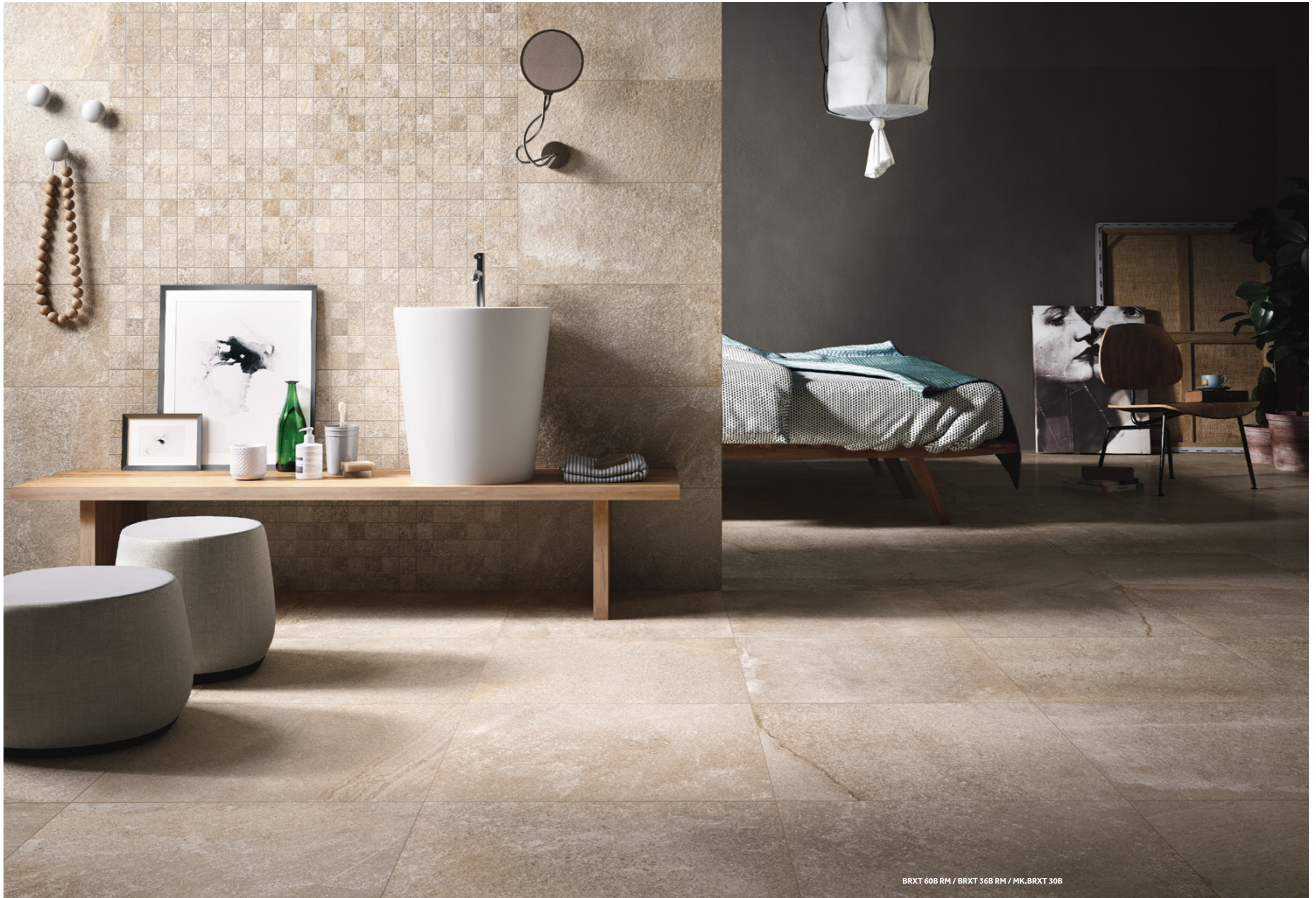
BRXT 60B RM / BRXT 36B RM / MK.BRXT 30B